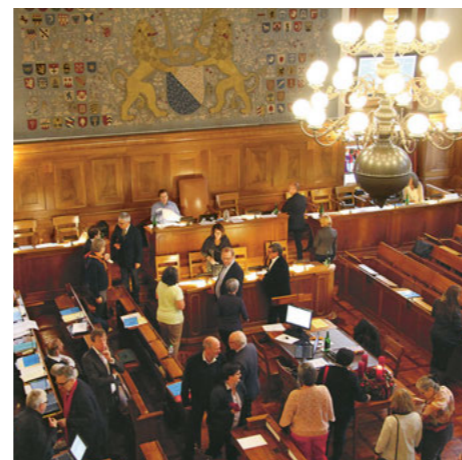
Die Synode tagt im Saal des Zürcher Rathauses.

Der Synode stehen dieselben parlamentarischen Instrumente zur Verfügung wie den staatlichen Parlamenten auch. Die Palette reicht von der verpflichtenden Motion und dem auffordernden Postulat über die Parlamentarische Initiative, Interpellation, Schriftliche Anfrage und Fragestunde bis hin zur Resolution. Die Ausgestaltung der Instrumente ist in der Geschäftsordnung der Synode geregelt. In der Fragestunde können neben Fragen an den Synodalrat auch dem Generalvikar Fragen gestellt und Anregungen unterbreitet werden.