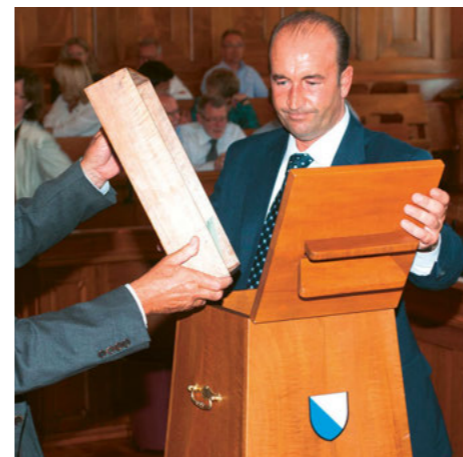
Synodalen wählen: Die eingesammelten Wahlzettel werden in die Wahlurne geleert, vom Ratsweibel in ein Nebenzimmer gebracht und dort ausgezählt.

Zu den Kernaufgaben des katholischen Parlaments gehören die Wahl ihres Präsidiums, Vizepräsidiums, ihrer Geschäftsleitung, ihrer ständigen Kommissionen und ihren Vertretungen in Institutionen, die Wahl der Exekutive (Synodalrat), der Rekurskommission, der Aufsichtskommission des Synodalrats über Kirchgemeinden und Zweckverbände sowie zweier Ombudspersonen.