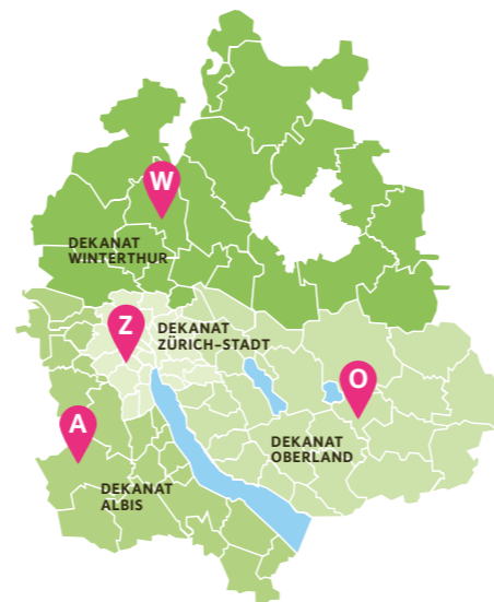
Die Synodalen organisieren sich aktuell in vier Fraktionen. Diese sind deckungsgleich mit den Dekanaten Albis, Oberland, Winterthur und Zürich.

Sie wählen eine siebenköpfige Geschäftsleitung, welche – zusammen mit ihrem Sekretariat – den Parlamentsbetrieb nach den Vorgaben der Geschäftsordnung organisiert. Neben der Geschäftsprüfungskommission und der Finanzkommission kennt die Zürcher Synode mit den Sachkommissionen für Seelsorge und für Bildung/Medien/Soziales zwei weitere ständige Kommissionen. Für spezielle Geschäfte kann die Synode weitere ständige oder nichtständige Kommissionen bilden.