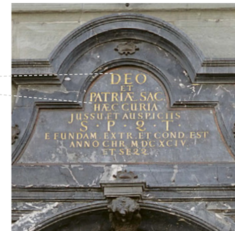
Eingangsportal des Zürcher Rathauses mit Inschrift und Löwen. Der Titel der Inschrift lautet: «DEO ET PATRIÆ SAC[ræ]». Auf deutsch: «Gott und dem Vaterland geweiht».